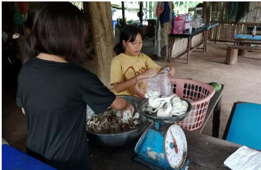
รูปภาพ : พวกเราช่วยกันนำเห็ดมาชั่งกิโล

ภาพประกอบการบันทึกประจำวันโครงการเกษตรเพื่ออาหารกลางวัน กิจกรรมการเพาะเห็ดนางฟ้า