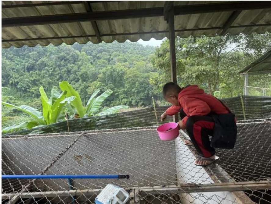
รูปภาพ : ผมกำลังให้อาหารกบตามปกติ

ภาพประกอบการบันทึกกิจกรรมโครงการเกษตรเพื่ออาหารกลางวัน กิจกรรมการเลี้ยงกบ