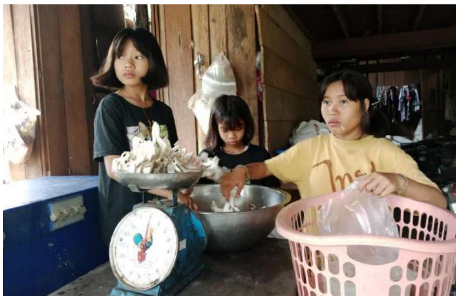
รูปภาพ : พวกเราช่วยกันนำเห็ดชั่งกิโลเพื่อขายให้ชาวบ้าน