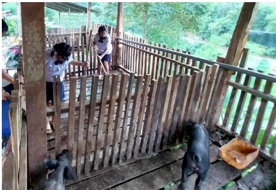
รูปภาพ : ล้างคอกให้หมู