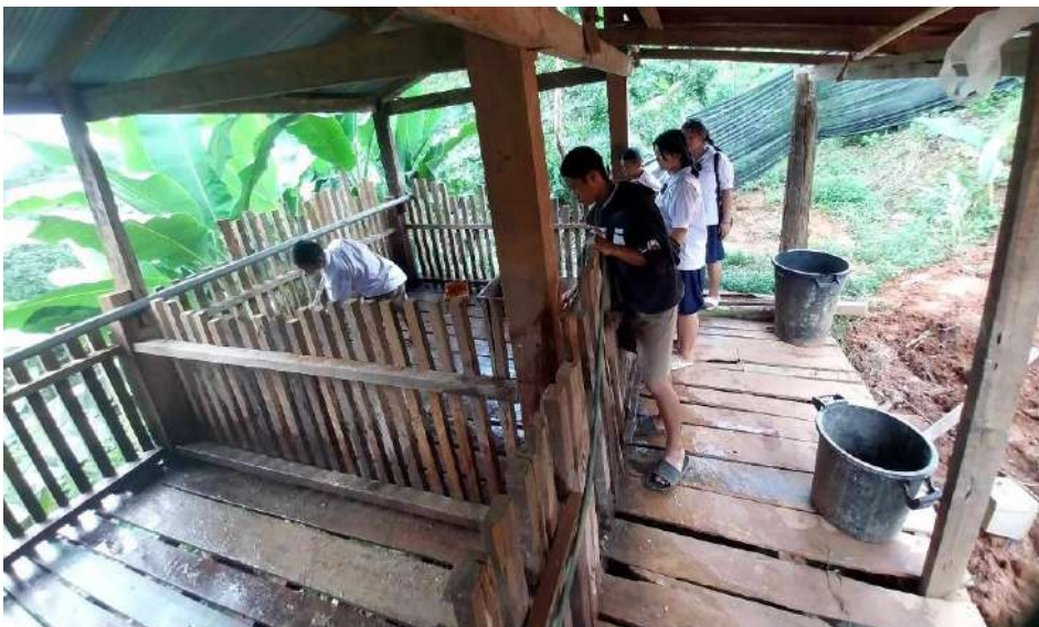
รูปภาพ : เอาอาหารให้หมู