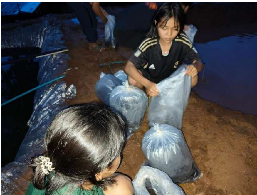
รูปภาพ : ตอนเย็นปล่อยปลาที่ได้ใหม่ลงบ่อ