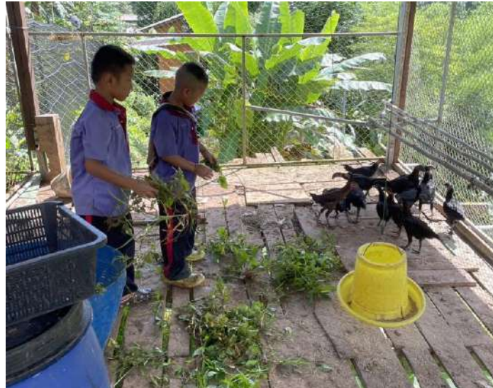
รูปภาพ : ผมและเพื่อน ๆ ให้อาหารไก่