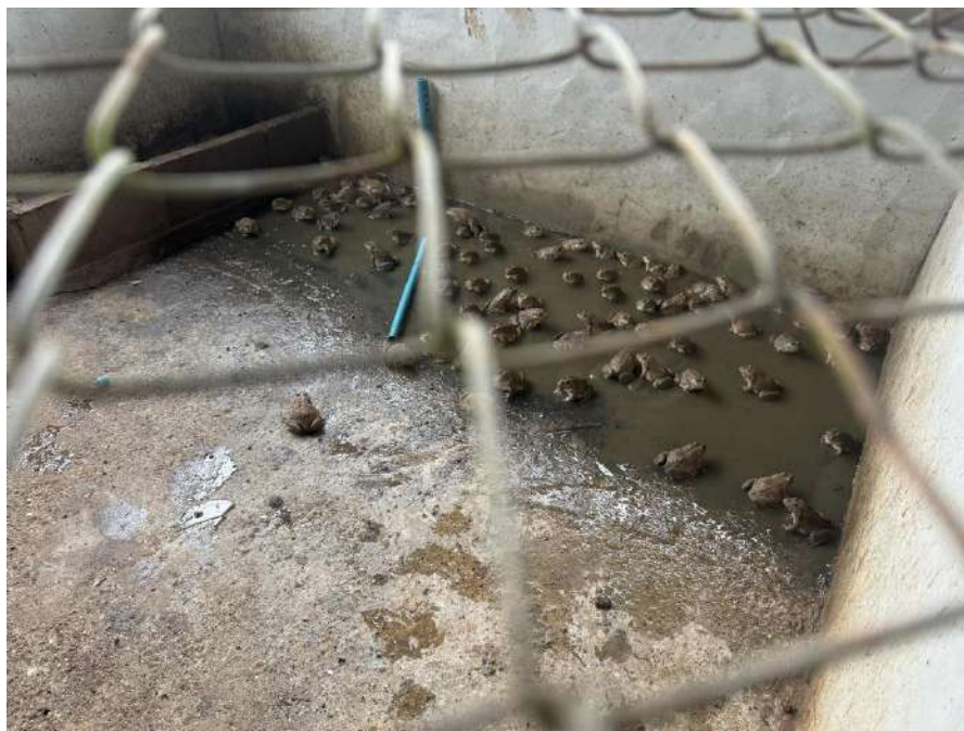
รูปภาพ : กบในบ่อกบของพวกเรา