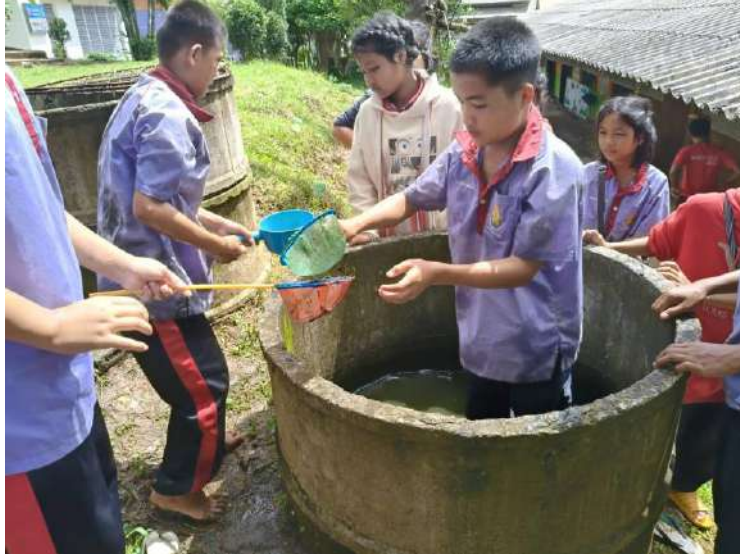
รูปภาพ : พวกเขาช่วยกันย้ายปลาออกจากบ่อเดิม

ภาพประกอบการบันทึกประจำวันโครงการเกษตรเพื่ออาหารกลางวัน กิจกรรมการเลี้ยงปลาตก