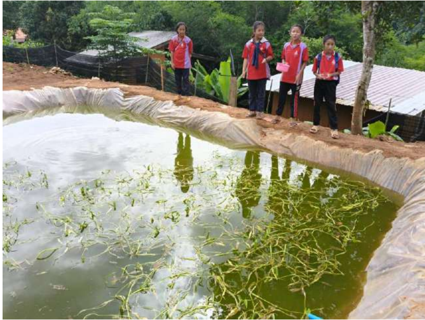
รูปภาพ : ให้อาหารปลาดุก

ภาพประกอบการบันทึกประจำวันโครงการเกษตรเพื่ออาหารกลางวัน กิจกรรมการเลี้ยงปลาดุก