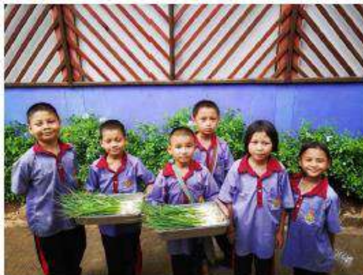
รูปภาพ : นำต้นหอมไปขายให้กับโรงอาหาร

ภาพประกอบการบันทึกประจำวันโครงการเกษตรเพื่ออาหารกลางวัน กิจกรรมการปลูกผักปลอดสารพิษ