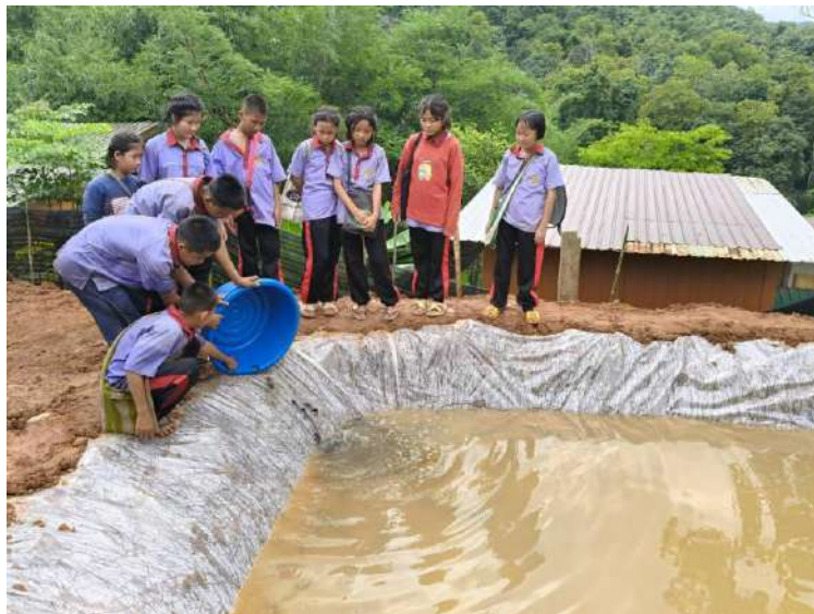
รูปภาพ : พวกเขาช่วยกันปล่อยปลาลงบ่อใหม่