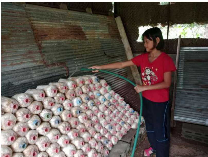
รูปภาพ : พวกเรารดน้ำให้เห็ดสามเวลา