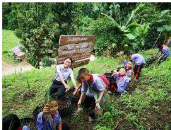
รูปภาพ : นำต้นหอมไปขายให้กับโรงอาหาร