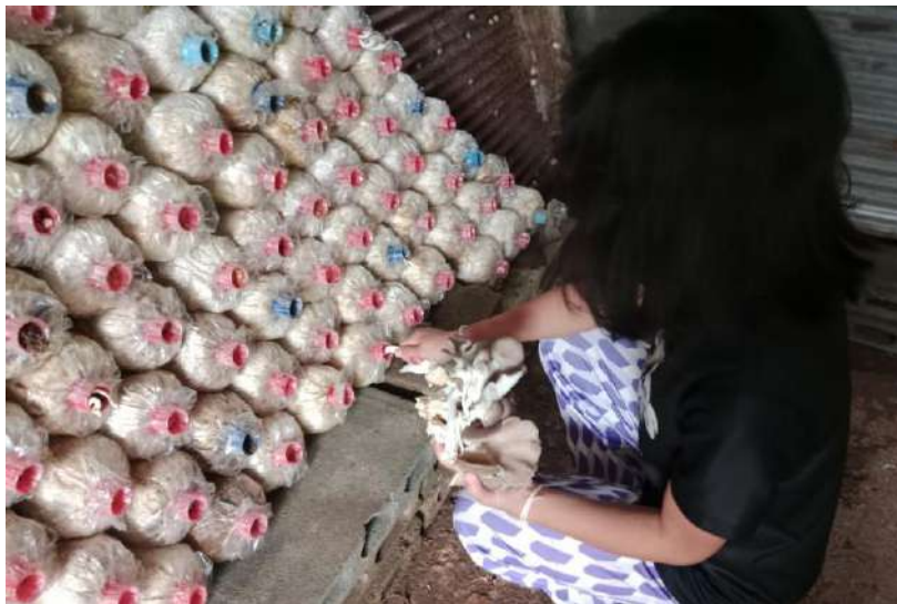
รูปภาพ : พวกเราช่วยกันเก็บเห็ดที่โตเต็มที่

ภาพประกอบการบันทึกประจำวันโครงการเกษตรเพื่ออาหารกลางวัน กิจกรรมการเพาะเห็ดนางฟ้า