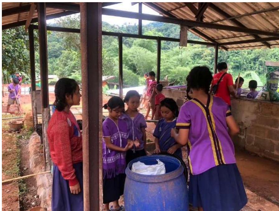
รูปภาพ : พวกเขาช่วยกันให้อาหารกบ