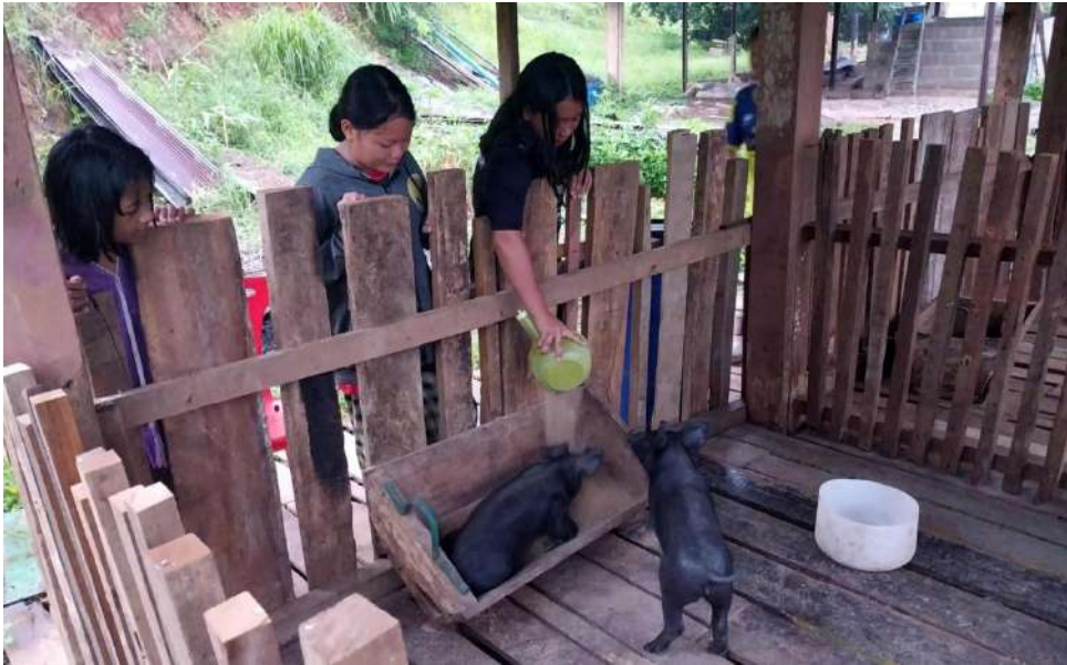
รูปภาพ : ล้างคอกให้หมู

ภาพประกอบการบันทึกประจำวันโครงการเกษตรเพื่ออาหารกลางวัน กิจกรรมการเลี้ยงสุกร