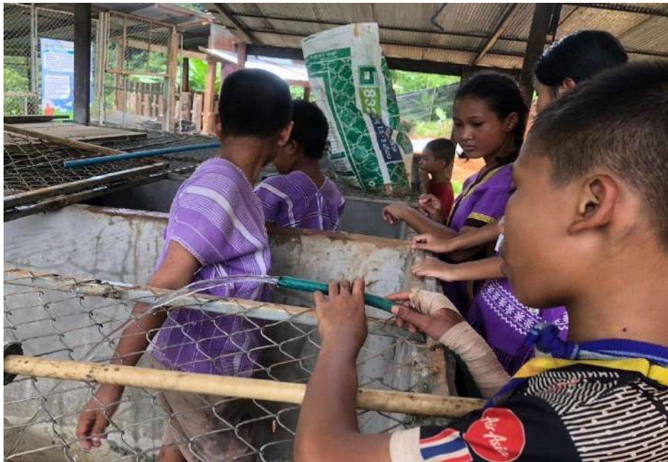
รูปภาพ : พวกเขาช่วยกันล้างบ่อกบใหม่