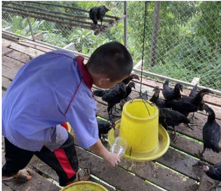
รูปภาพ : ให้อาหารไก่

ภาพประกอบการบันทึกกิจกรรมโครงการเกษตรเพื่ออาหารกลางวัน กิจกรรมการเลี้ยงไก่พันธุ์พื้นเมือง