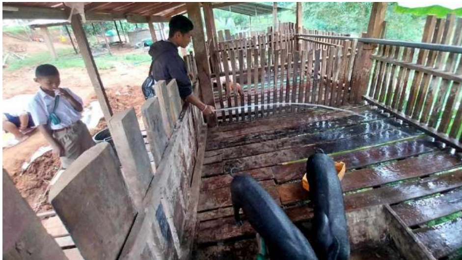
รูปภาพ : ล้างคอกให้หมู

ภาพประกอบการบันทึกประจำวันโครงการเกษตรเพื่ออาหารกลางวัน กิจกรรมการเลี้ยงสุกร