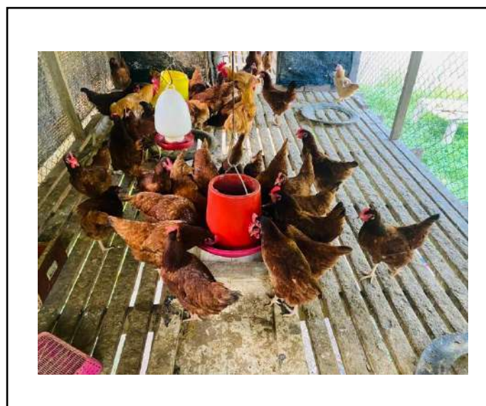
ภาพที่ ๓ ให้อาหารไก่