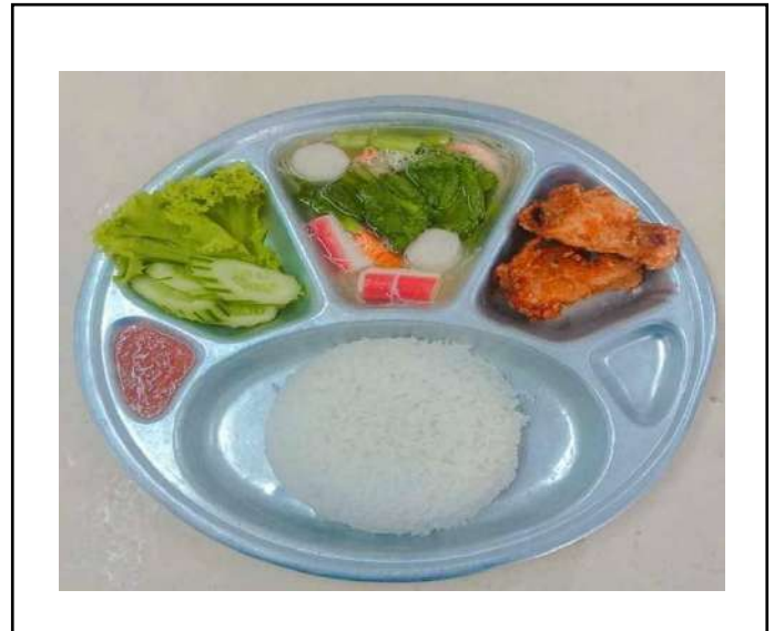
ภาพที่ ๔ เมนูอาหารกลางวัน