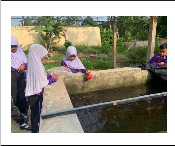
ภาพที่ ๑. ให้อาหารปลา