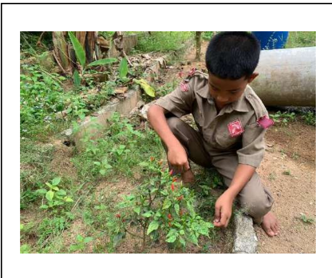
ภาพที่ ๓ เก็บพริก