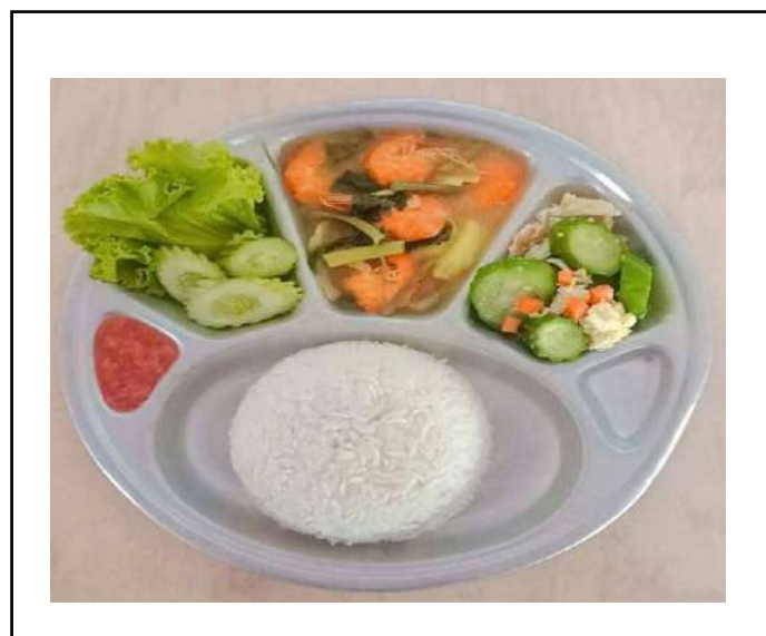
ภาพที่ ๔ ผักกะเพรา/ถั่วเขียวต้ม