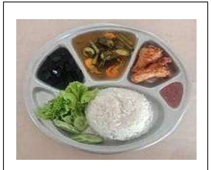
ภาพที่ ๔ เมนูอาหารกลางวัน