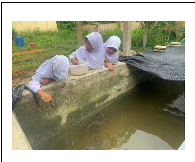
ภาพที่ ๓ ให้อาหารปลา