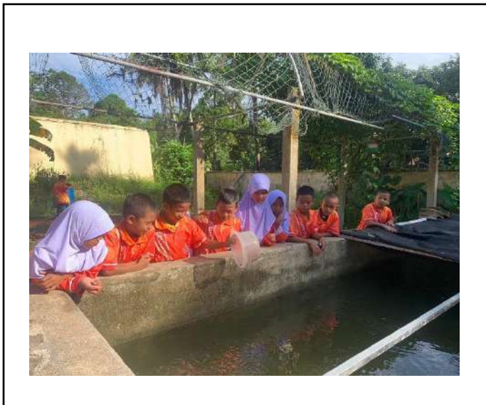
ภาพที่ ๑ ถอนหญ้าในแปลงตะไคร้