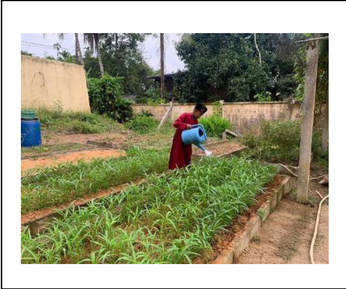
ภาพที่ ๑ รดน้ำผักบุ้ง