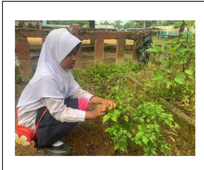
ภาพที่ ๒ เก็บพริกชี้หูสวน