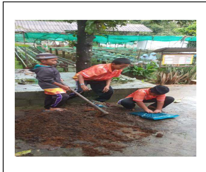
ภาพที่ ๒ ผสมดินและปุ๋ย