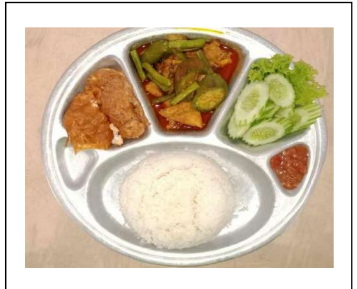
ภาพที่ ๔ เมนูอาหารกลางวัน