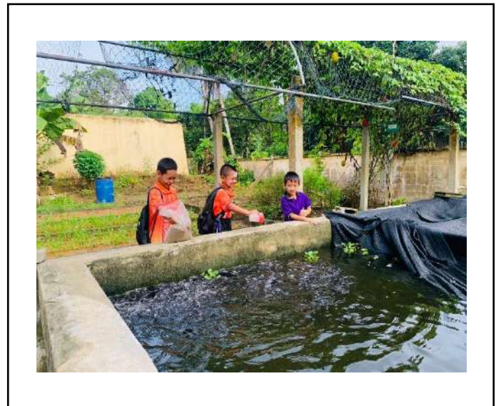
ภาพที่ ๒.ให้อาหารปลาดุก