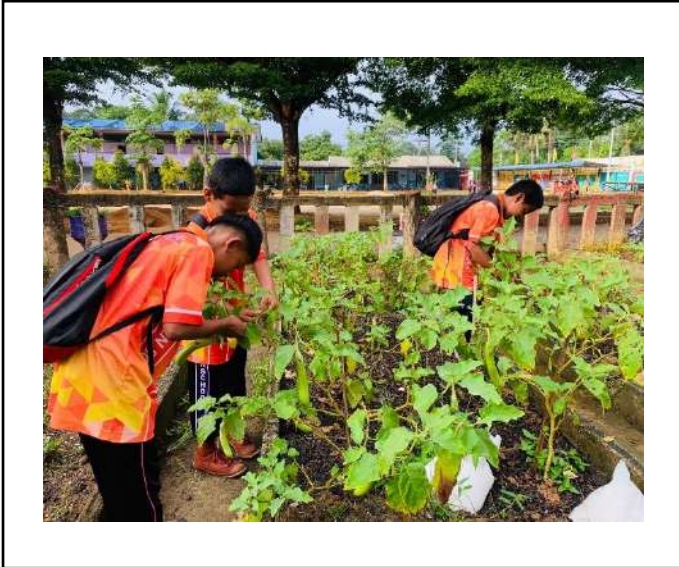
ภาพที่ ๑. เก็บมะเขือยาว