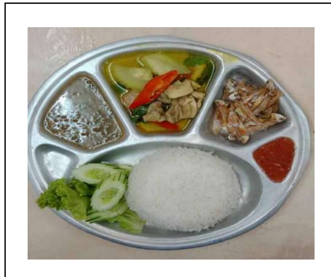
ภาพที่ ๔ เมนูอาหารกลางวัน