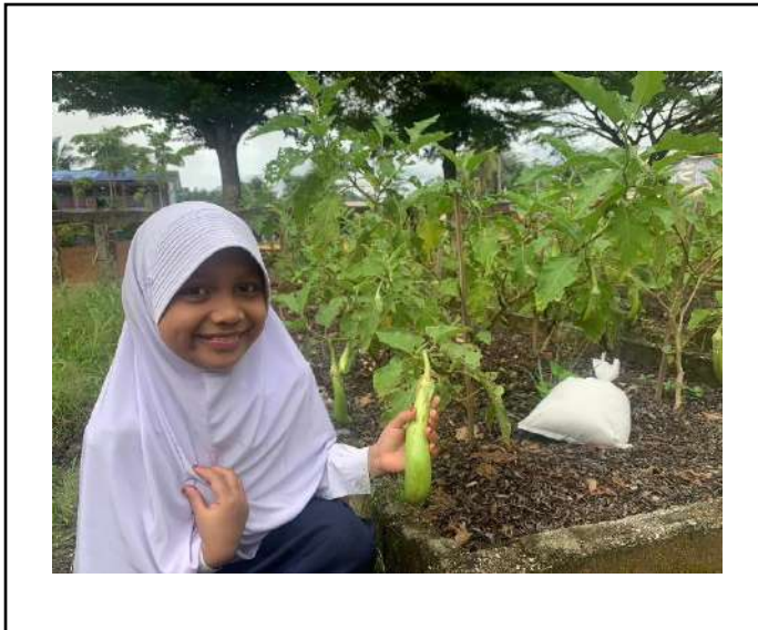
ภาพที่ ๑ เก็บมะเขือยาว