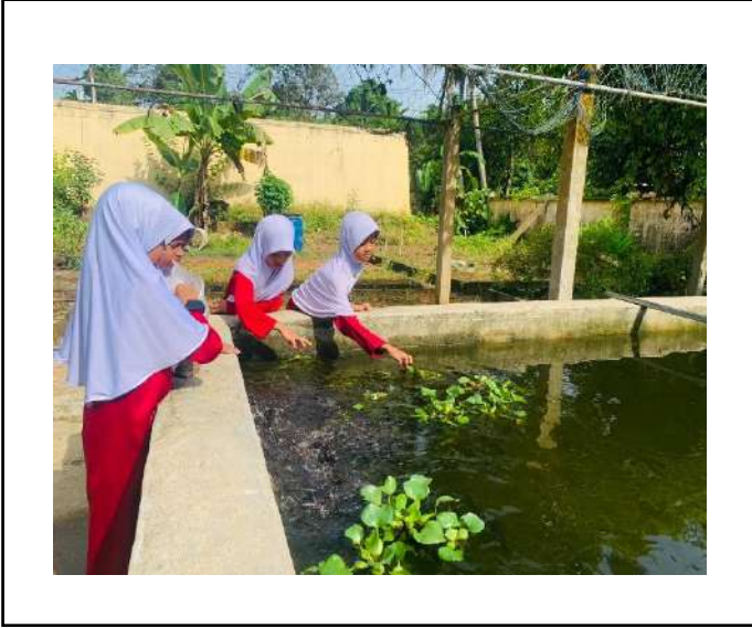
ภาพที่ ๑. ให้อาหารปลา