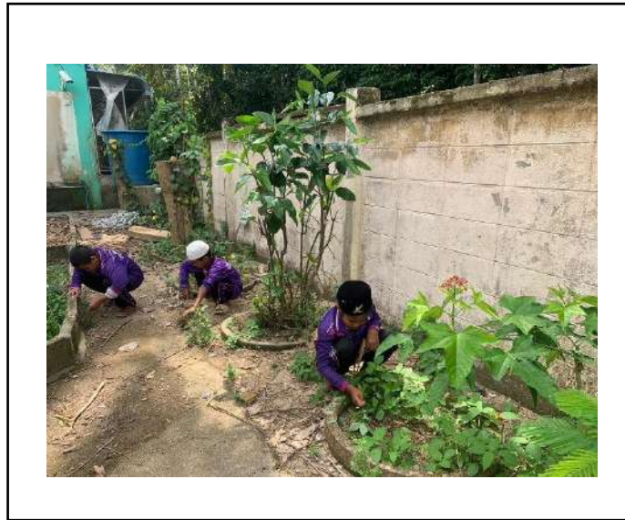
ภาพที่ ๒ ถอนหญ้าแปลงสมุนไพร