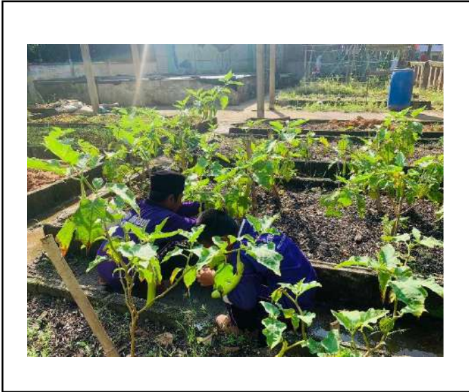
ภาพที่ ๑. เก็บมะเขือยาว