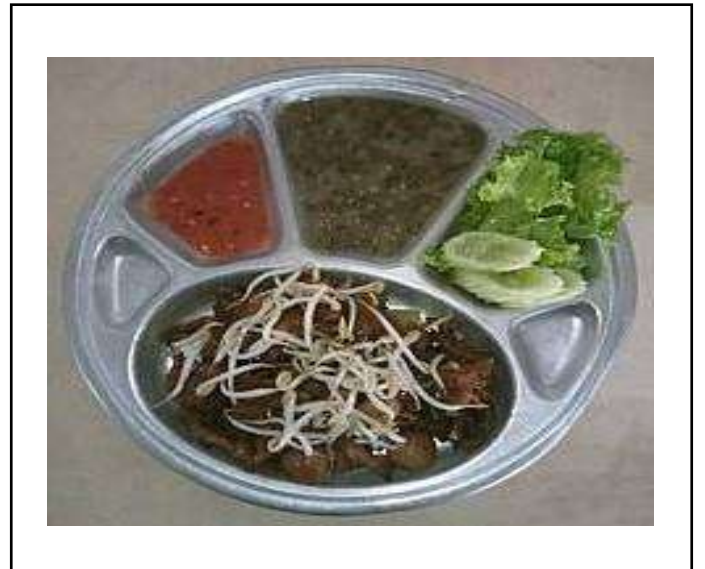
ภาพที่ ๔. เมนูอาหารกลางวัน