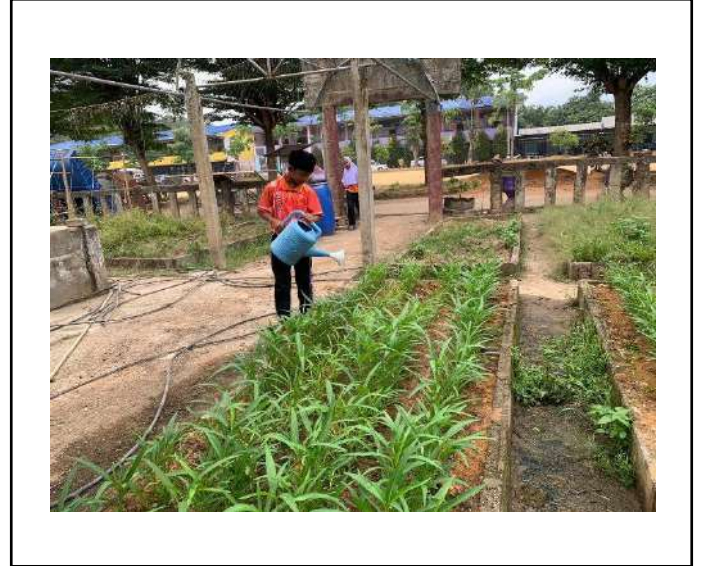
ภาพที่ ๒ รดน้ำผักบุ้ง