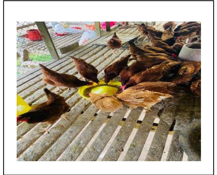
ภาพที่ ๒ ให้อาหารไก่