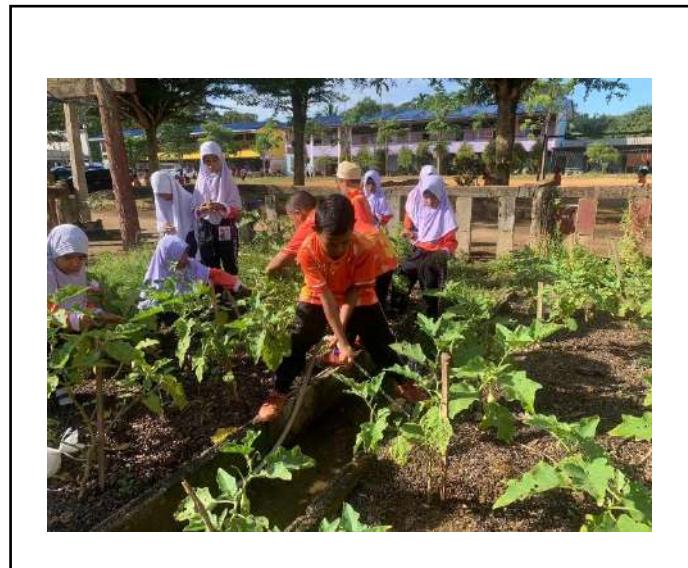
ภาพที่ ๒ รดน้ำ พรวนดิน มะเขือยาว