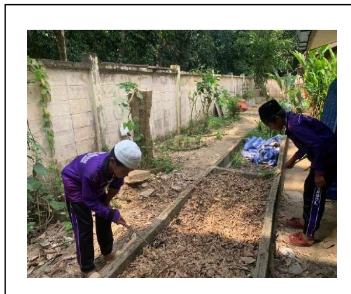
ภาพที่ ๓ เก็บเศษใบไม้แห้ง ทำปุ๋ยหมัก