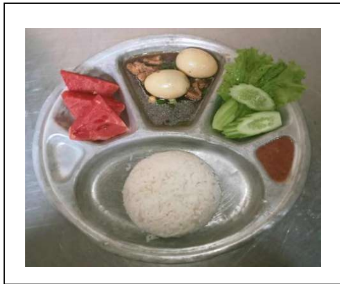
ภาพที่ ๔ เมนูอาหารกลางวัน