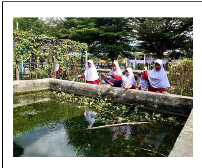
ภาพที่ ๓ ให้อาหารปลาตุ๊ก