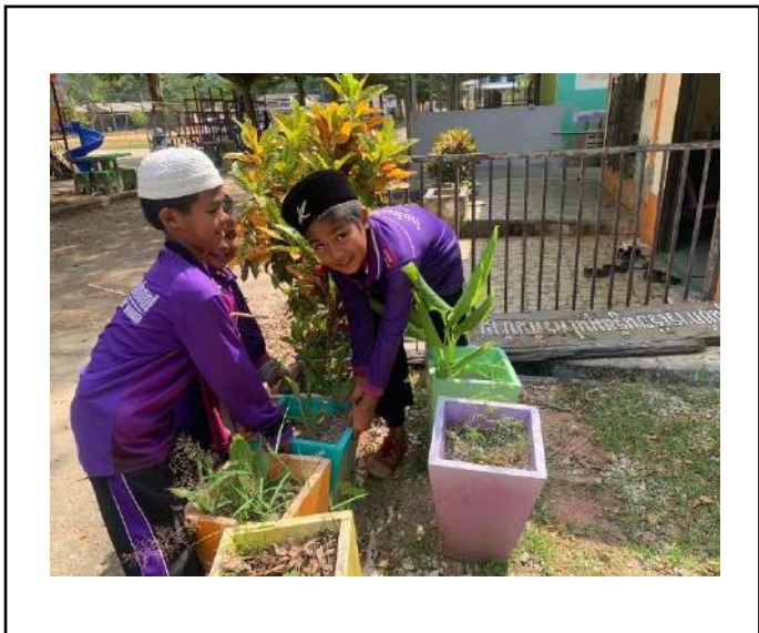
ภาพที่ ๑ ทำความสะอาดบริเวณต้นขมิ้น