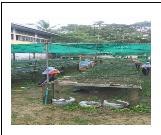
ภาพที่ ๑ ทำความสะอาดแปลงผักยกแคร่