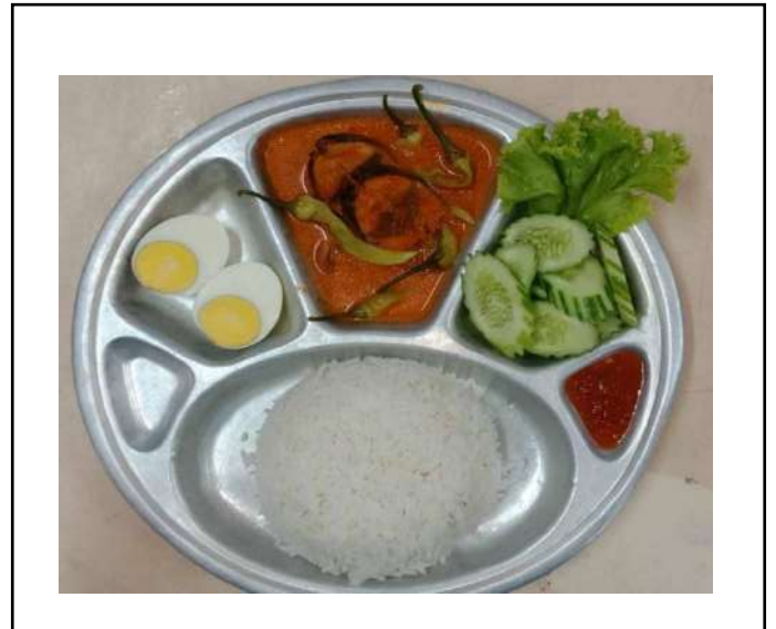
ภาพที่ ๔ เมนูอาหารกลางวัน