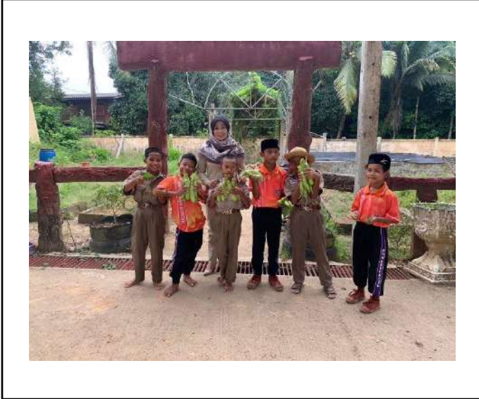
ภาพที่ ๑ เก็บมะเขือยาว