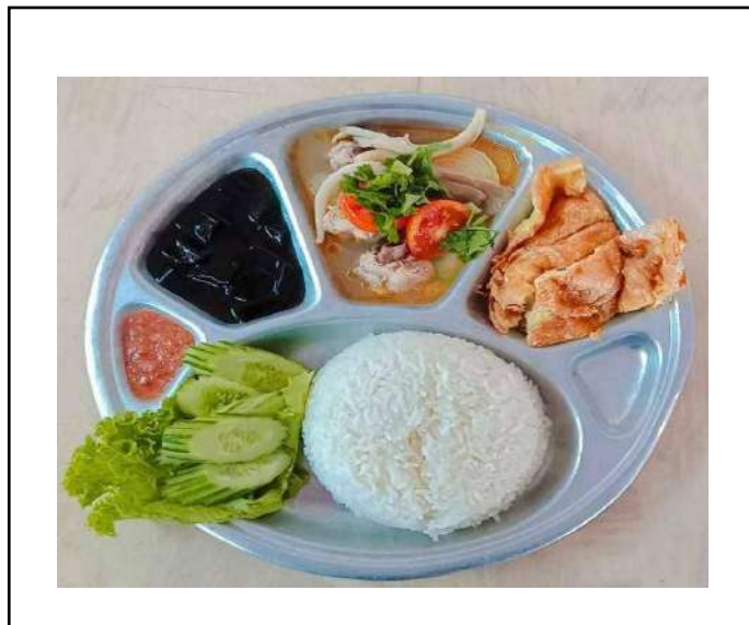
ภาพที่ ๔ อาหารกลางวัน