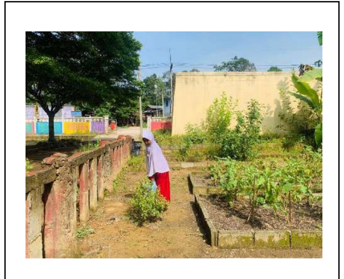
ภาพที่ ๒. รดน้ำต้นกระเพรา