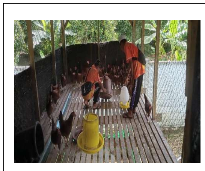
ภาพที่ ๓ ให้อาหารไก่