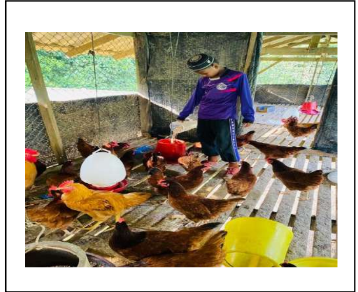
ภาพที่ ๒. ให้อาหารไก่