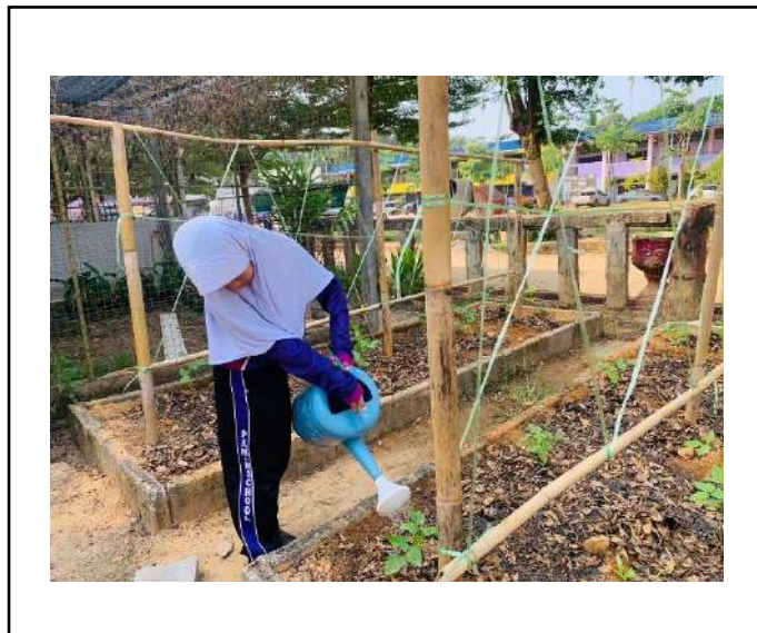
ภาพที่ ๓. รดน้ำผักต่างๆที่แปลงเกษตร