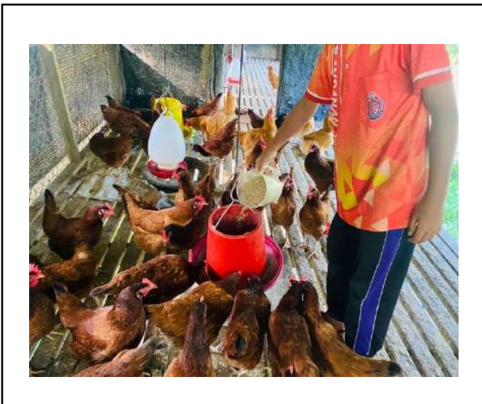
ภาพที่ ๓.ให้อาหารไก่