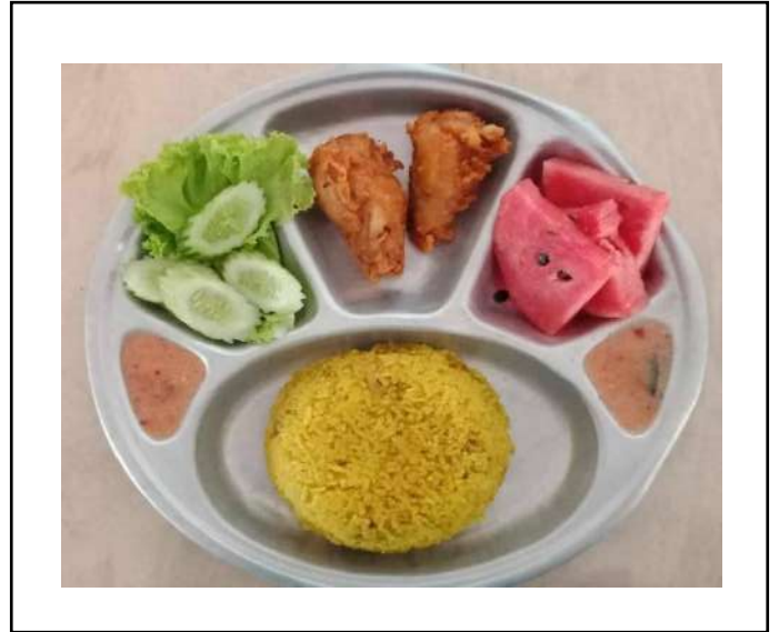
ภาพที่ ๔. เมนูอาหารกลางวัน