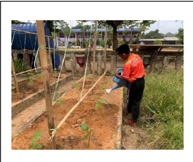
ภาพที่ ๓. รดน้ำต้นถั่วฝักยาว