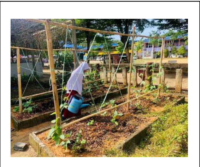
ภาพที่ ๓. ถอนหญ้าในแปลงเกษตร