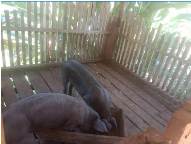
ภาพ หมูกำลังกินอาหาร