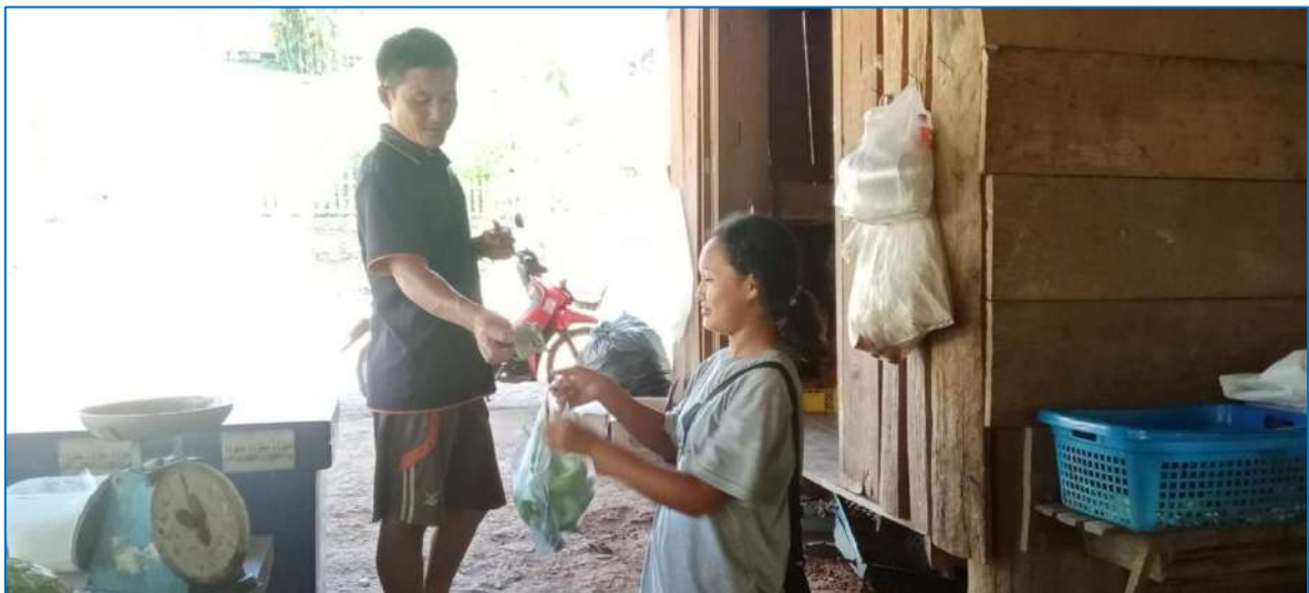
ภาพ ขายมะเขือให้กับผู้ปกครอง