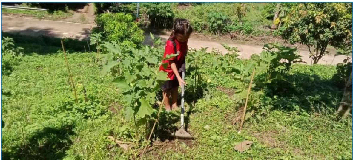
ภาพ พรวนดินให้กับมะเขือ