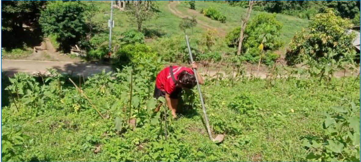
ภาพ ถอนหญ้ามะเขือ

ภาพประกอบการบันทึกกิจกรรมโครงการเกษตรเพื่ออาหารกลางวัน กิจกรรมการปลูกผัก