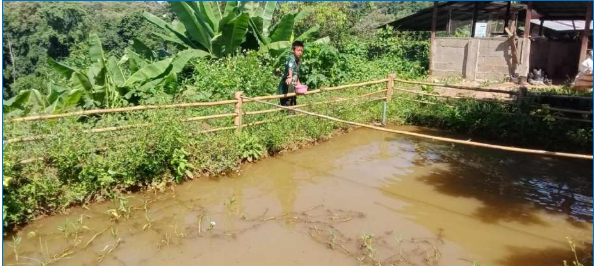
ภาพ ให้อาหารปลา

ภาพประกอบการบันทึกกิจกรรมโครงการเกษตรเพื่ออาหารกลางวัน กิจกรรมการเลี้ยงปลาดุก