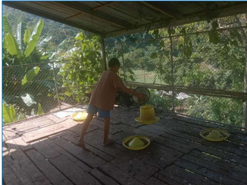
ภาพ ให้อาหารไก่