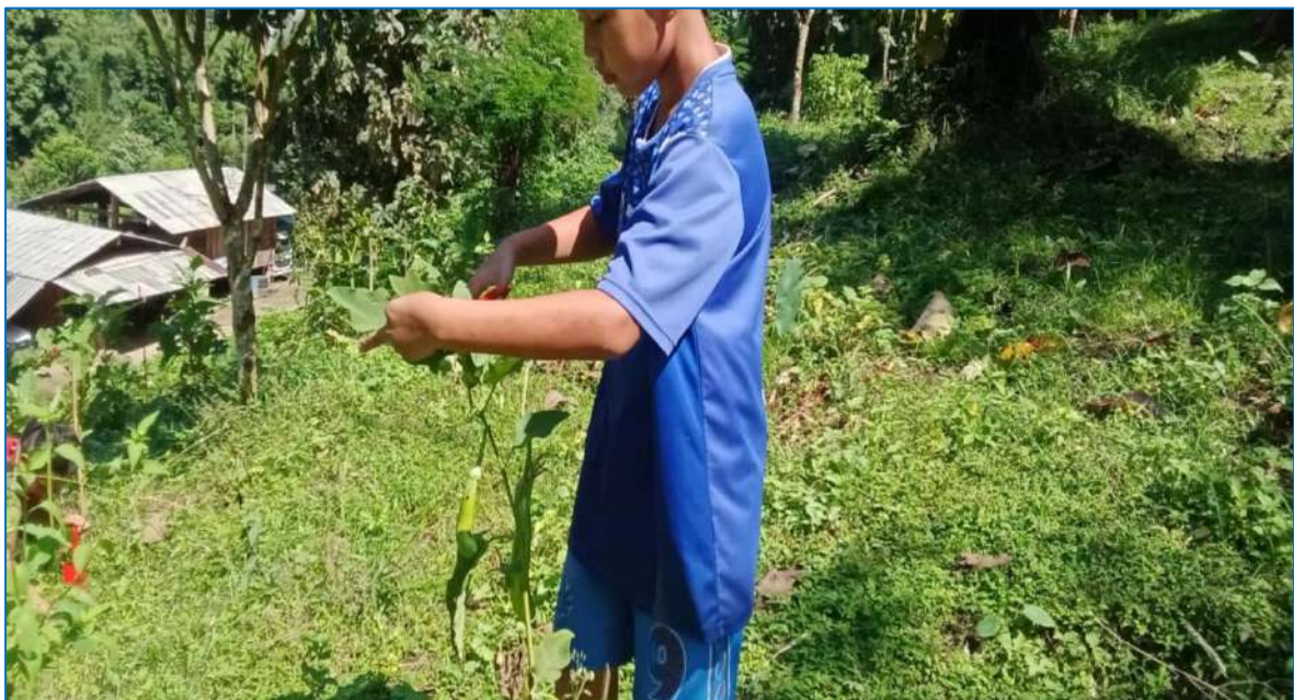
ภาพ ตัดแต่งกิ่งมะเขือ