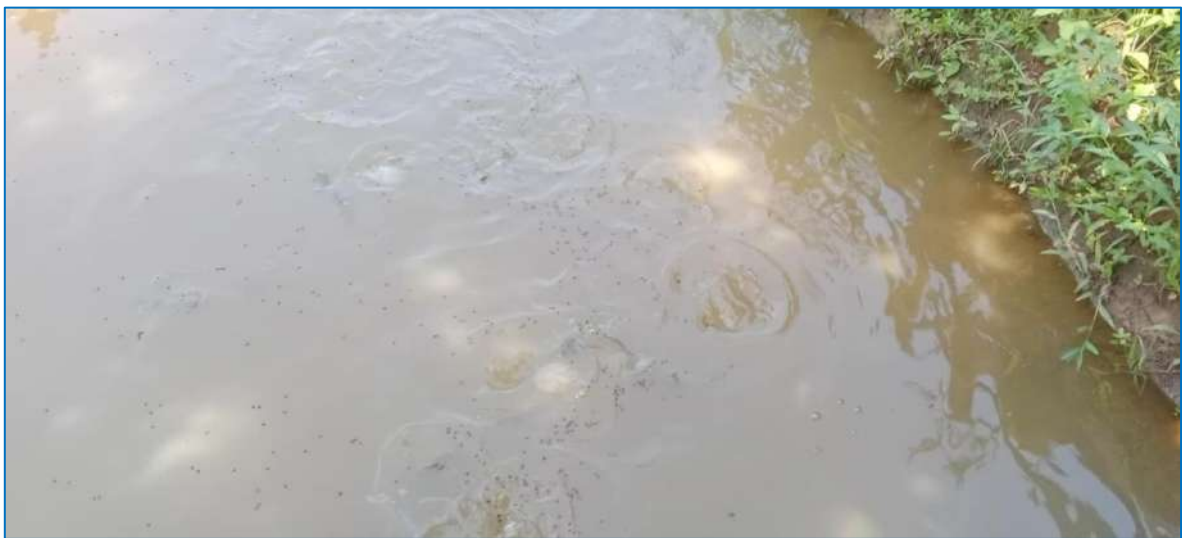
ภาพ ปลากำลังกินอาหาร