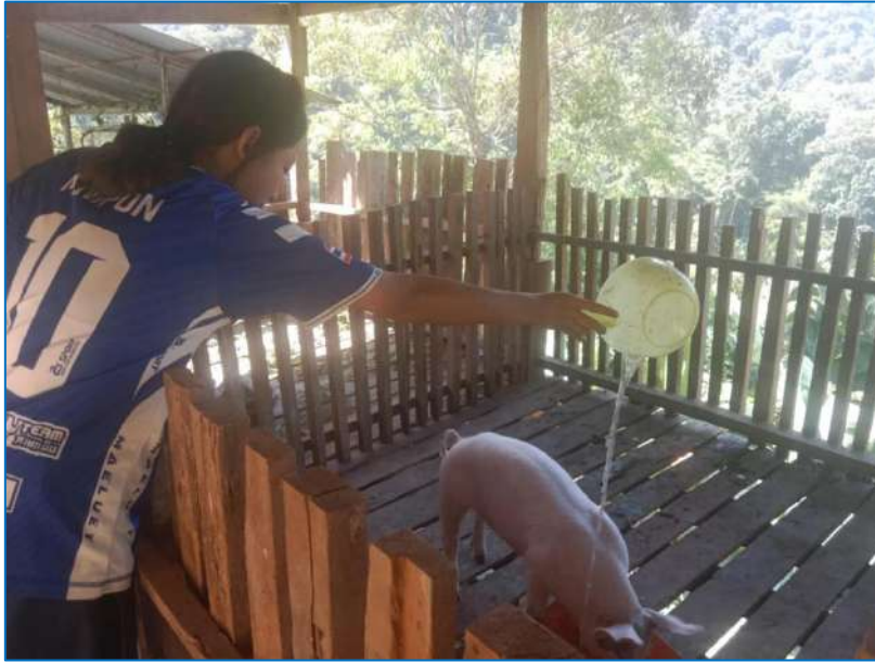
ภาพ การให้น้ำสุกร

ภาพประกอบการบันทึกประจำวันโครงการเกษตรเพื่ออาหารกลางวัน กิจกรรมการเลี้ยงสุกร