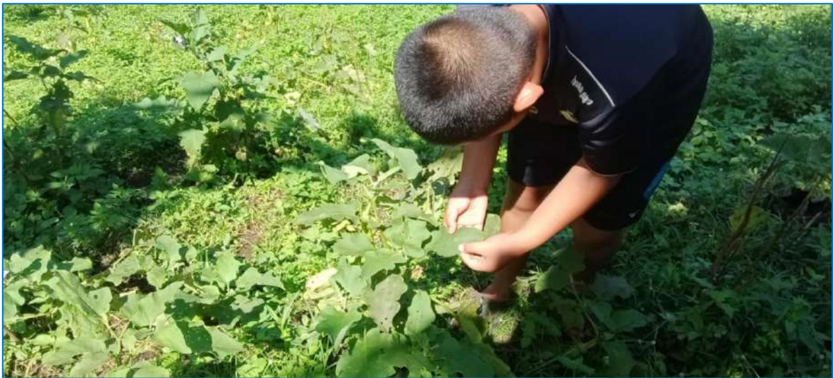
ภาพ ตรวจสอบใบมะเขือ