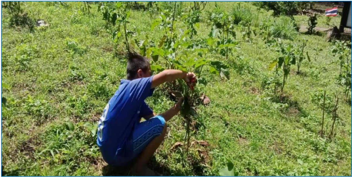
ภาพ ตัดแต่งกิ่งมะเขือ