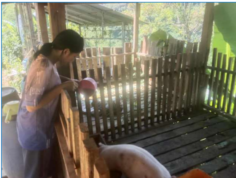
ภาพ ให้อาหารสุกร