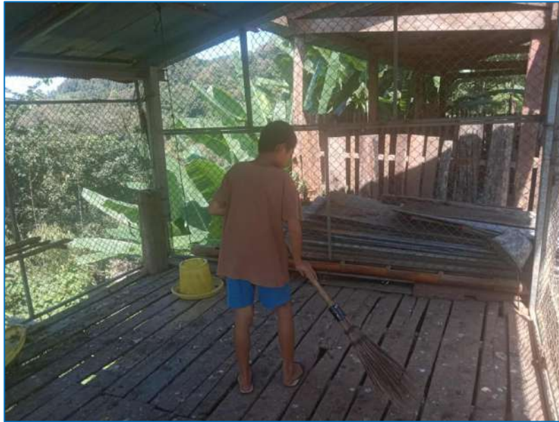
ภาพ ทำความสะอาดเล้าไก่

ภาพประกอบการบันทึกประจำวันโครงการเกษตรเพื่ออาหารกลางวัน กิจกรรมการเลี้ยงไก่