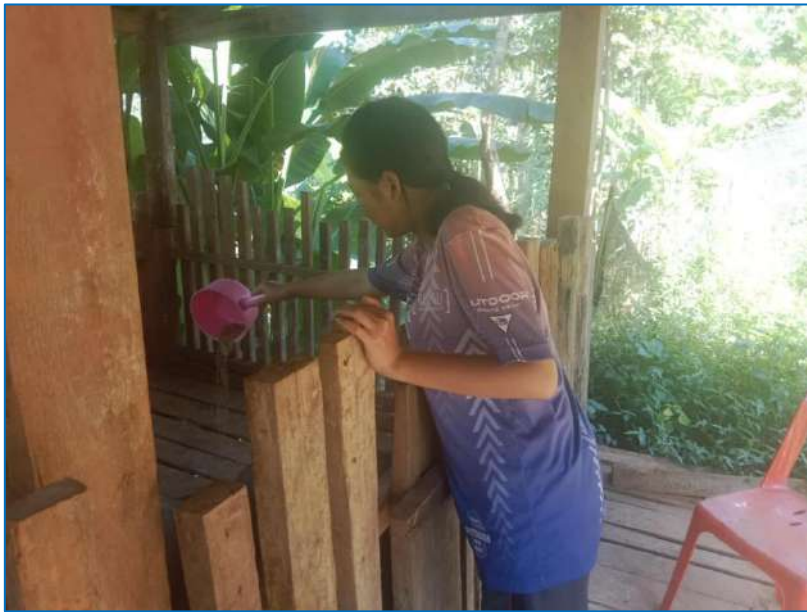
ภาพ ให้อาหารสุกร