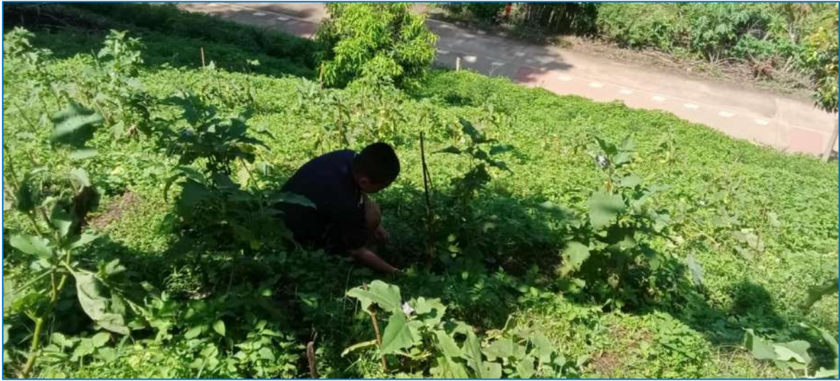
ภาพ ถอนหญ้าให้ต้นมะเขือ