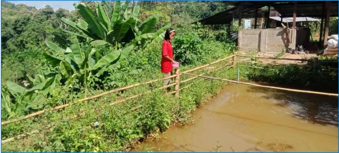
ภาพ ให้อาหารปลาตก

ภาพประกอบการบันทึกประจำวันโครงการเกษตรเพื่ออาหารกลางวัน กิจกรรมการเลี้ยงปลาตก