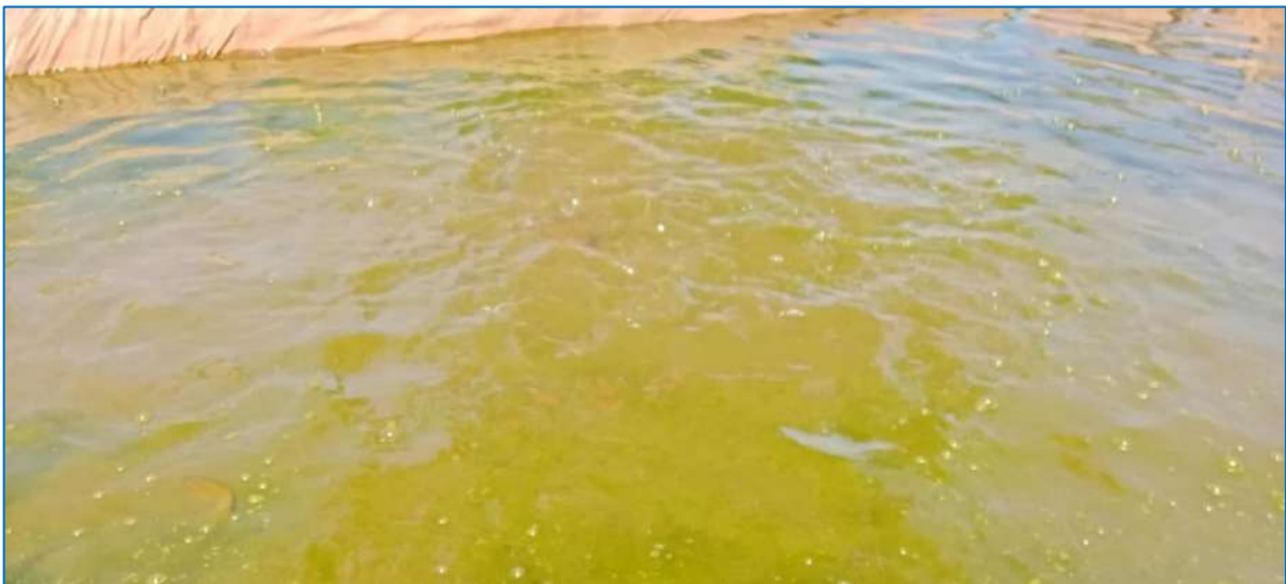
ภาพ ปลากำลังกินอาหาร