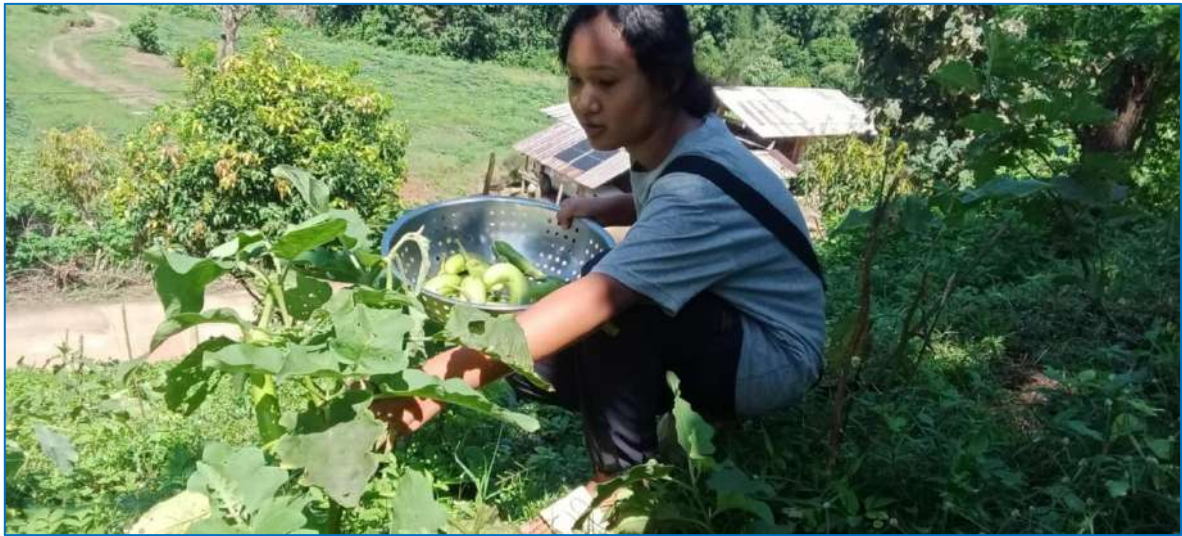
ภาพ เก็บมะเขือ

ภาพประกอบการบันทึกกิจกรรมโครงการเกษตรเพื่ออาหารกลางวัน กิจกรรมการเลี้ยงสุกรขุน