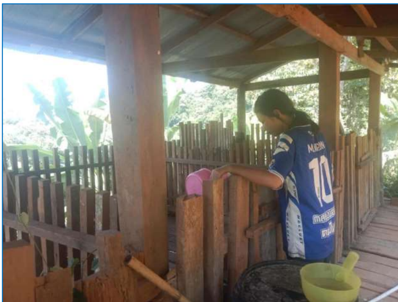
ภาพ การให้อาหารสุกร